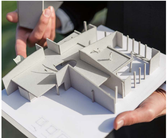
Maquette de présentation d'un projet lors d'un concours d'architecture. [22]

Pour les concours d'architecture ou de mandats d'étude, un signal fort en faveur du bois est d'intégrer au jury, des experts issus de l'économie de la forêt ou de l'industrie du bois. (Art. 16 de l'Ordonnance sur les marchés publics OMP [17]).