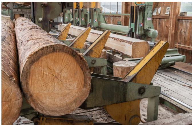
Sciage de grumes dans la scierie. [24]

Les besoins en bois doivent être soigneusement planifiés à toutes les étapes de la transformation afin que tous les acteurs de la chaîne de valeur puissent correctement enregistrer leurs besoins et réagir si nécessaire.